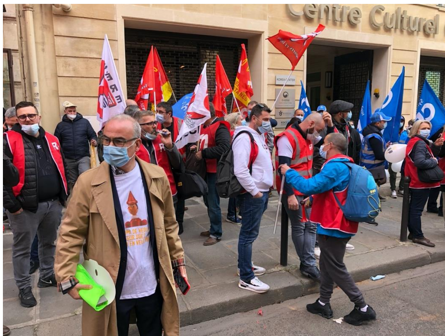
Camarades FO et manifestants, en face du siège de Véolia