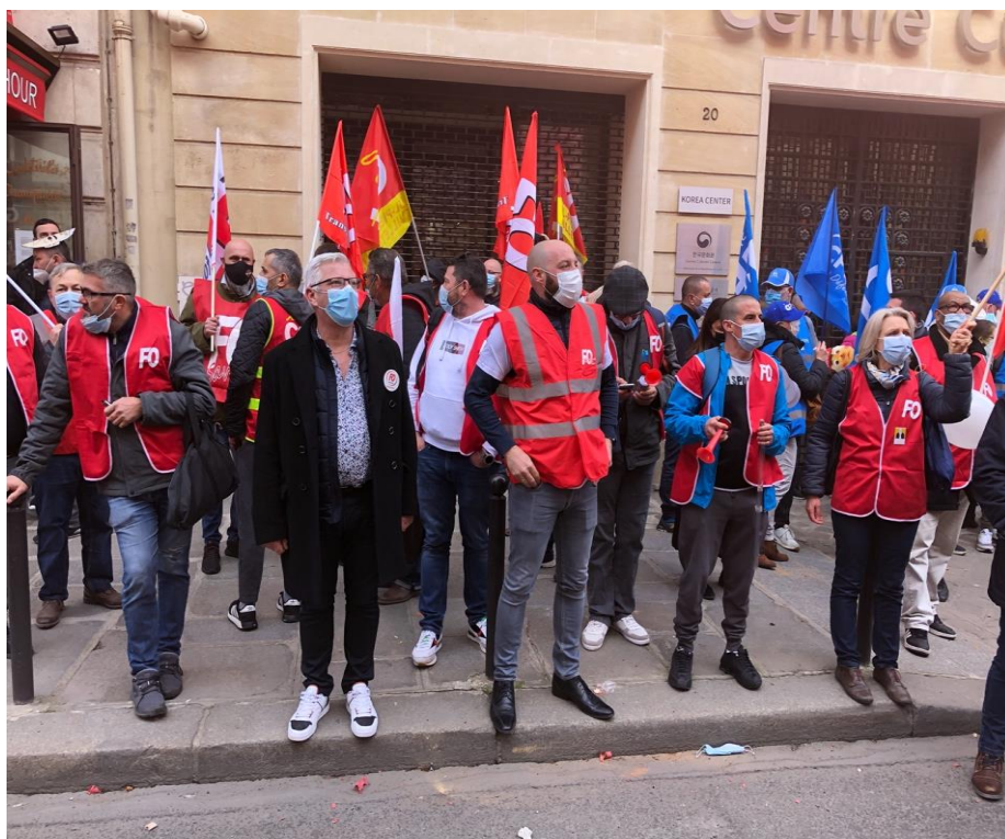
Le secrétariat fédéral

Fédération des Personnels des Services Publics et des Services de Santé Force Ouvrière